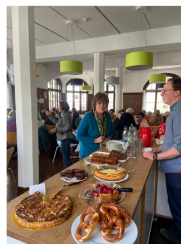
Kirchenkaffee am 28.04.2024